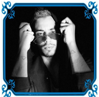
Il maestro delle opinioni